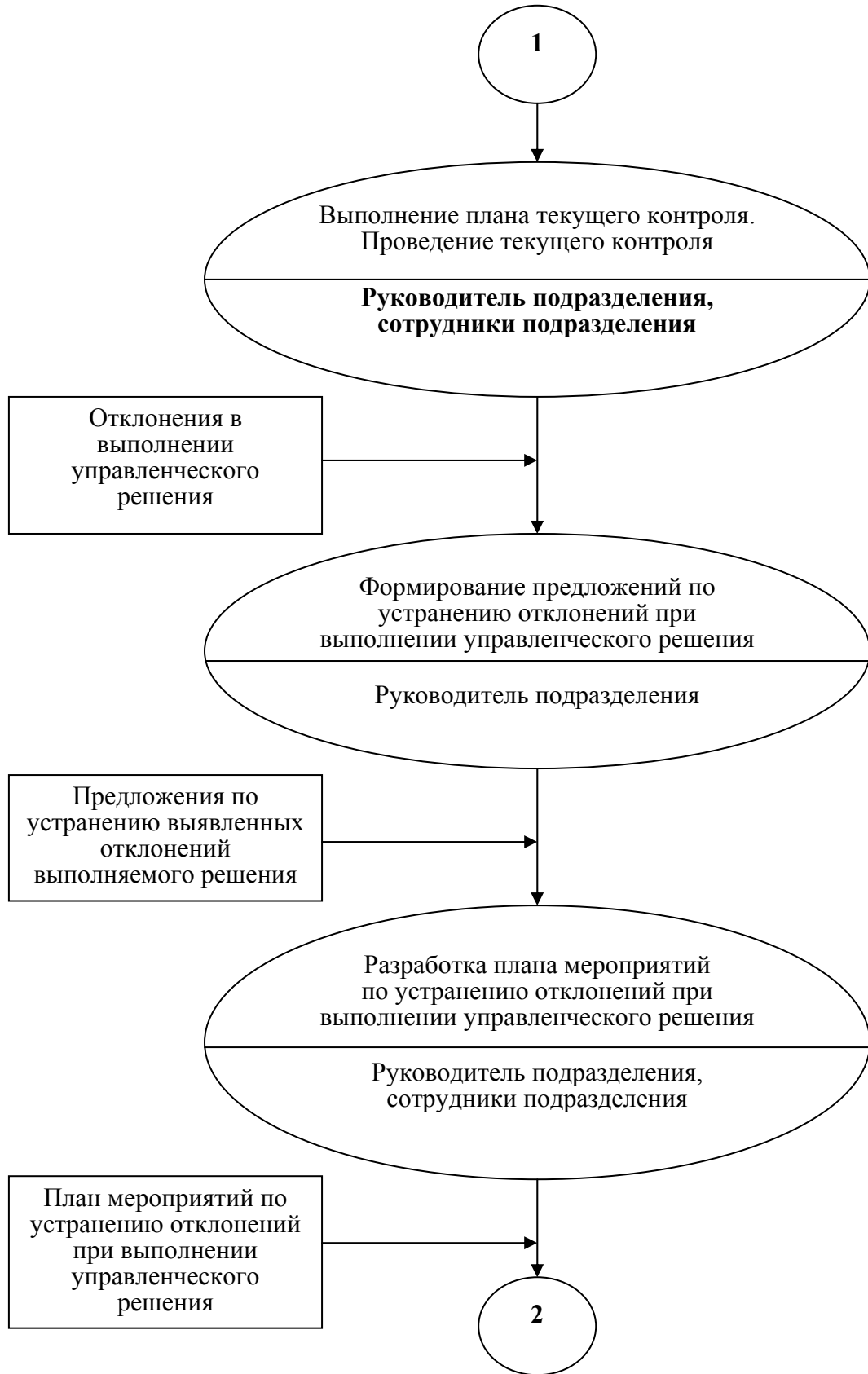
Рис. 1. Информационно-процедурная модель функционирования ТЭУ подразделения в инновационной инфраструктуре на этапе выполнения управленческого решения (продолжение)