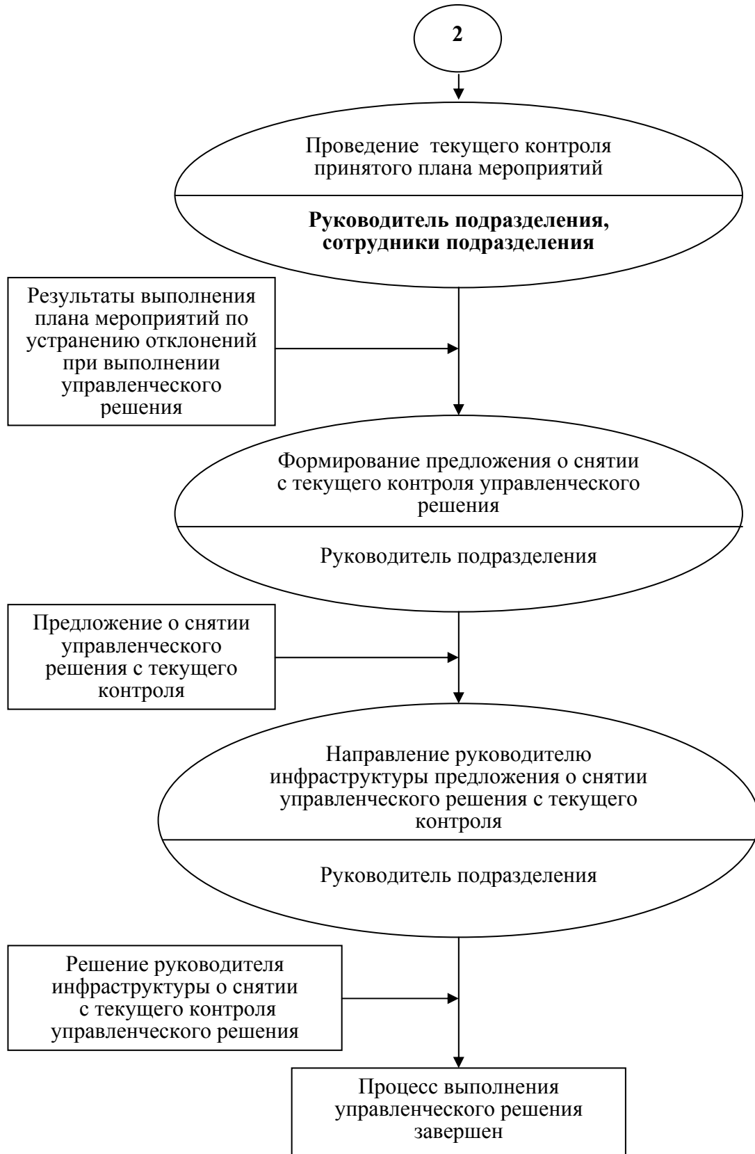
Рис. 1. Информационно-процедурная модель функционирования ТЭУ подразделения в инновационной инфраструктуре на этапе выполнения управленческого решения (окончание)