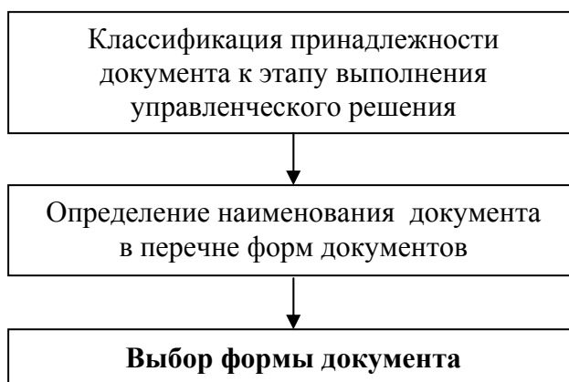
Рис. 3. Процедура поиска информации в базе данных форм документов на этапе выполнения управленческого решения