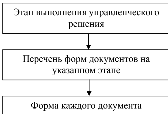
Рис. 2. Структура базы данных форм документов на этапе выполнения управленческого решения