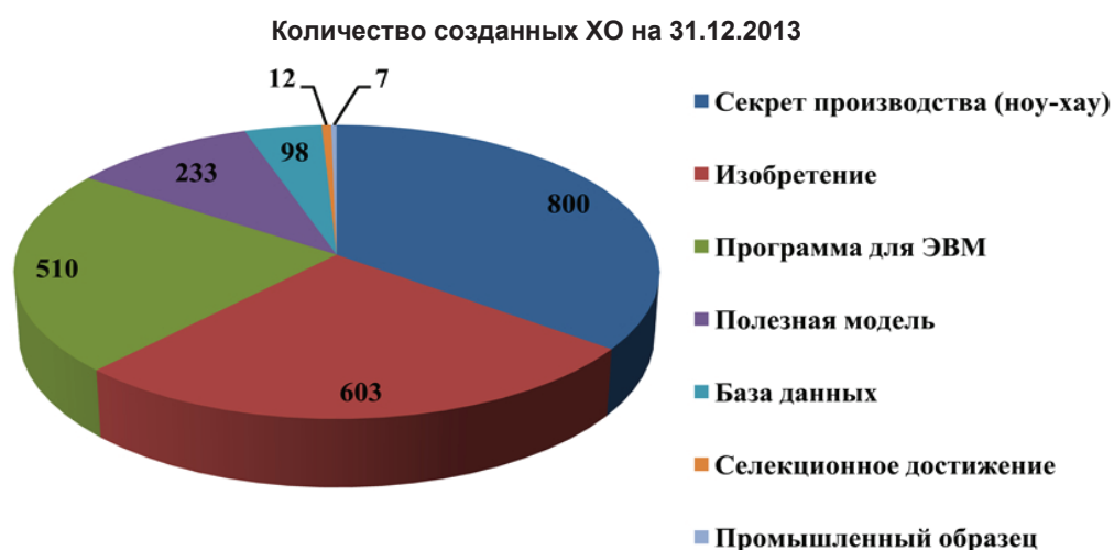
Рис. 1. Сведения о видах и количестве РИД, право использования которых внесено в уставные капиталы ХО