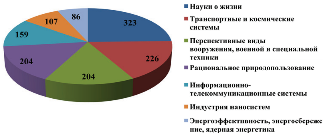
Рис. 3. Соответствие деятельности ХО по приоритетным направлениям развития науки, технологий и техники в Российской Федерации