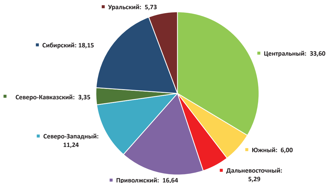
Рис. 2. Распределение малых инновационных предприятий по федеральным округам, %

ние МИП, действующих на настоящий момент, происходило в период 2010–2011 гг. и стало убывать к 2022 г. В 2010 г. были созданы и действуют сегодня 307 МИП, в 2011 г. соответственно – 325 МИП, в 2018 г. соответственно – 92 МИП, в 2021 г. соответственно – всего 36 МИП, а в 2022 г. соответственно – 5 МИП.