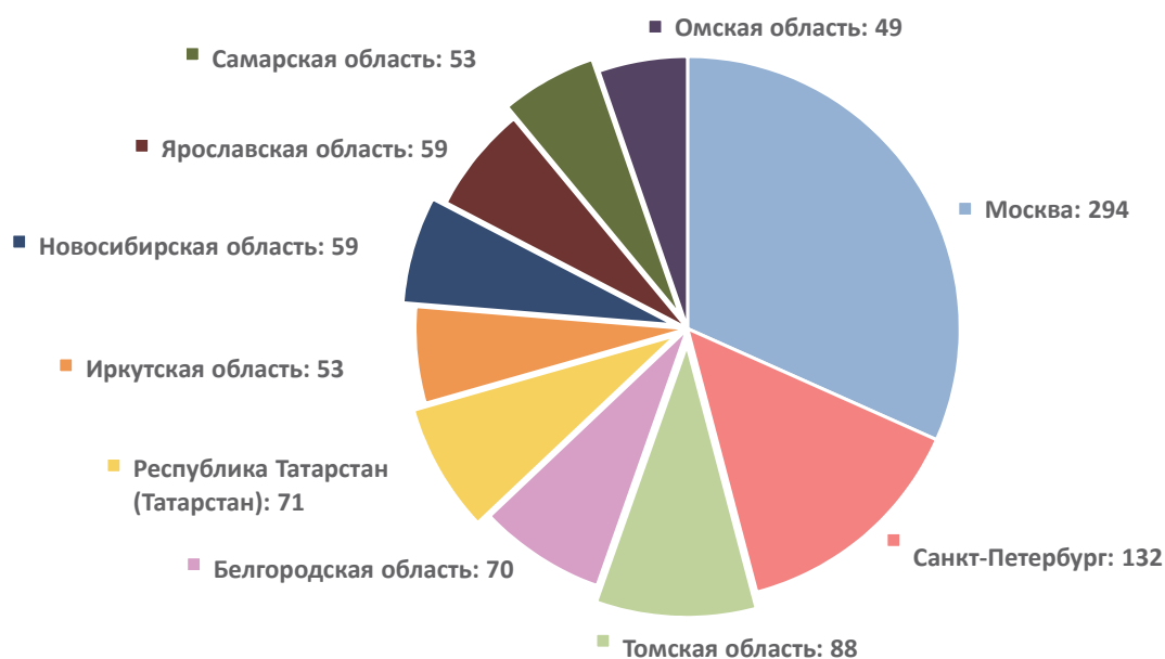
Рис. 5. Десять субъектов Российской Федерации, в которых создано наибольшее количество малых инновационных предприятий

Это связано не только с экономическими причинами, вызванными в 2020–2021 гг. пандемией коронавируса, но и с недостаточностью в вузах кадрового потенциала для обеспечения деятельности МИП.