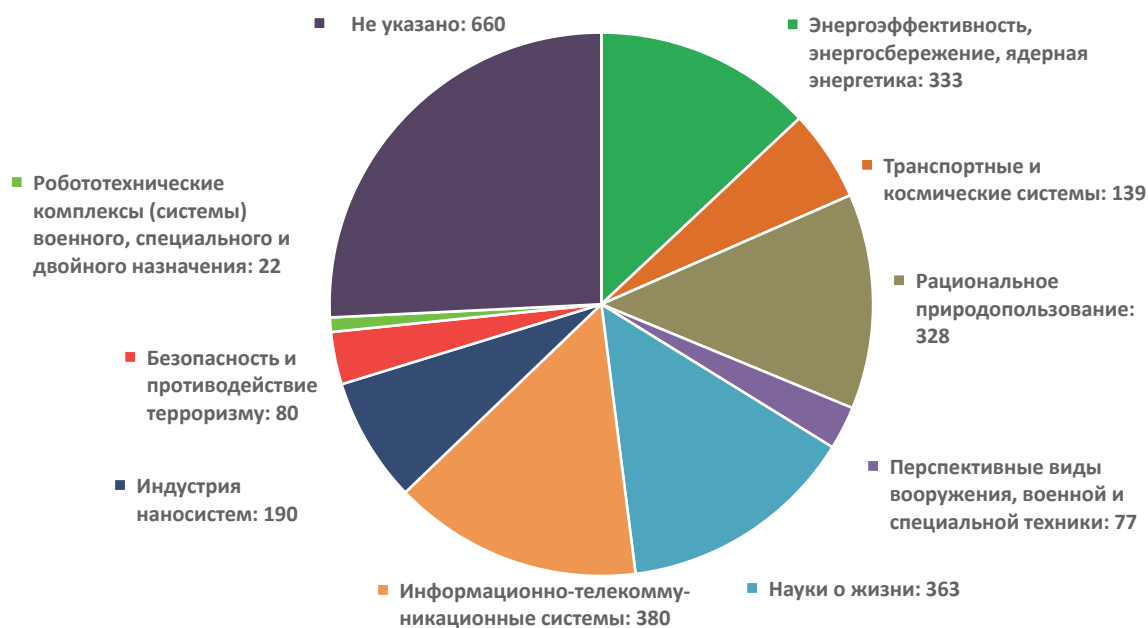
Рис. 4. Количество малых инновационных предприятий по приоритетным направлениям развития науки, технологий и техники