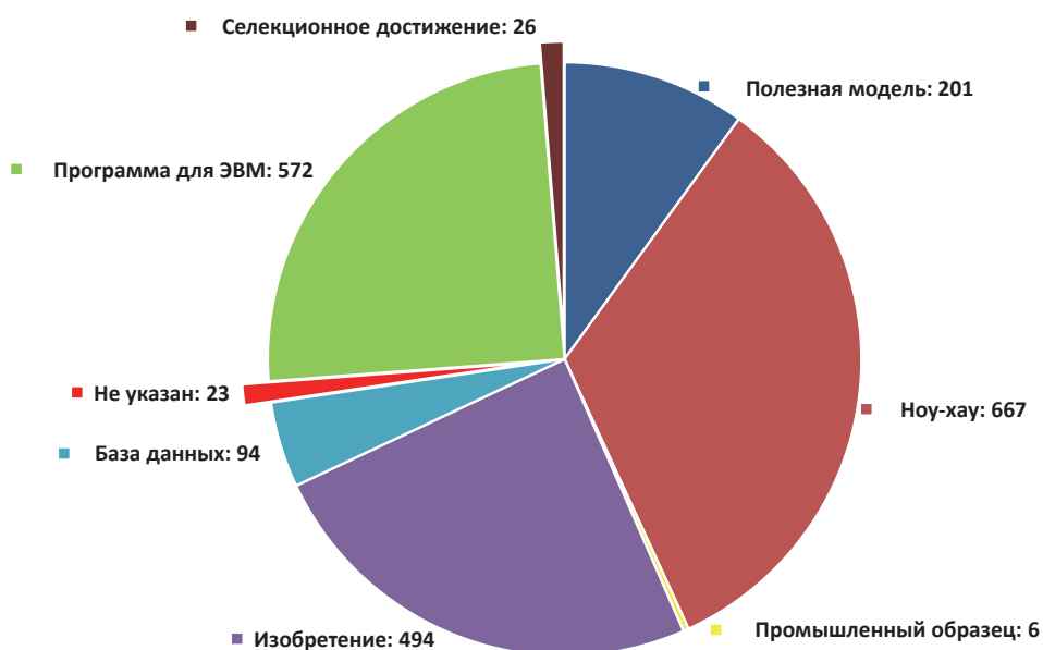
Рис. 3. Количество малых инновационных предприятий по видам РИД