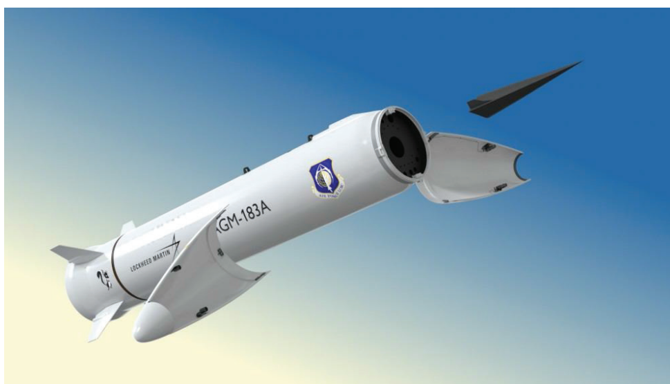
Рис. 2. Гиперзвуковой планирующий боевой блок клиновидной формы Tactical Boost Glide ракеты AGM-183A