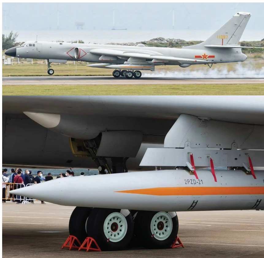
Рис. 5. Гиперзвуковая противокорабельная ракета YJ-21 на подвеске стратегического бомбардировщика Xian H-6K ВВС НОАК во время Airshow China – 2022

в результате чего ракетой YJ-21 в случае воздушного базирования возможно оснащать только бомбардировщики ВВС НОАК. По мнению издания South China Morning Post (опубликовавшего фото Xian H-6K с ракетой YJ-21), демонстрация авиационной версии ракеты YJ-21 может рассматриваться как предупреждение США о недопустимости военной поддержки Тайваня [14].