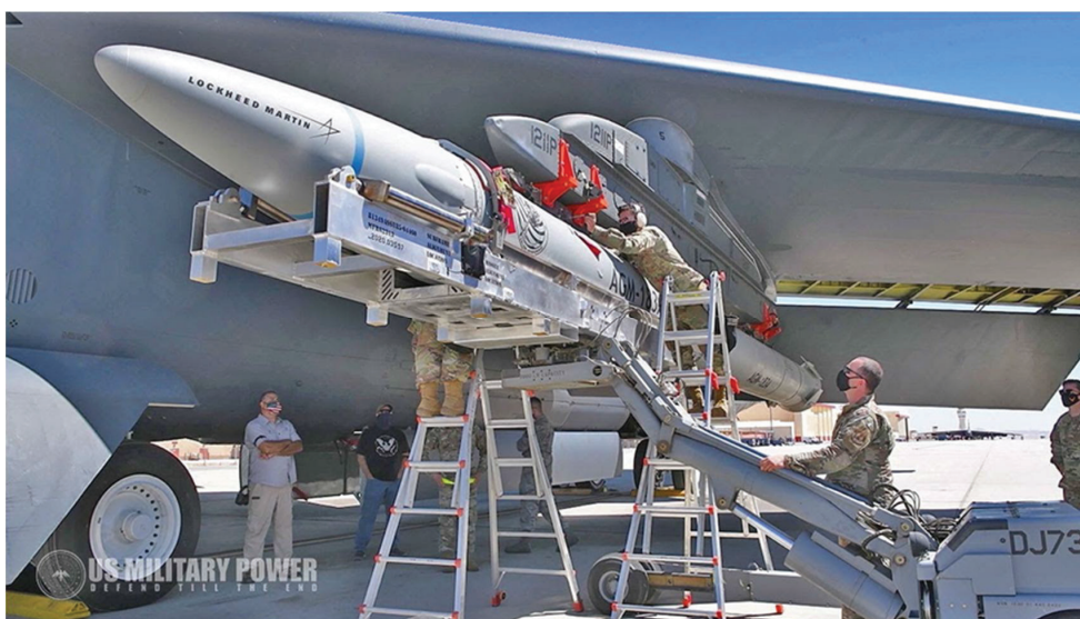
Рис. 1. Подвеска ракеты AGM-183A с твердотопливным ускорителем и управляемым боевым блоком на самолет-носитель B-52H

полностью комплектной ракеты AGM-183A ARRW с гиперзвуковой боевой ступенью – она отделилась от самолета-носителя, стартовала, развила скорость полета более 5М и отделила гиперзвуковой клиновидный глассирующий боевой блок ТВГ (рис. 2), который, в свою очередь, совершил полет по программе и достиг точки прицеливания в заданном районе Тихого океана.