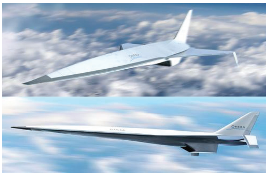
Рис. 4. Концептуальная модель гиперзвукового самолета (ГЛА) по проекту Espadon центра аэрокосмических исследований ONERA (Франция)

Проект Espadon был запущен центром ONERA по просьбе Минобороны Франции и пока что осуществляется за счет собственного финансирования французского центра аэрокосмических исследований. В настоящее время специалисты ONERA не планируют проектирование будущего ГЛА, а проводят комплексную оценку и определение технологий, необходимых для его создания. Для успешной реализации проекта предстоит решить значительный спектр научно-технических проблем, в частности создание надежной системы теплозащиты ГЛА, разработку и внедрение новых передовых материалов, создание силовой установки, решение задач аэродинамики планера, изучение механизма запуска оружия из внутренних отсеков такого ГЛА на гиперзвуковой скорости и ряд других проблем.