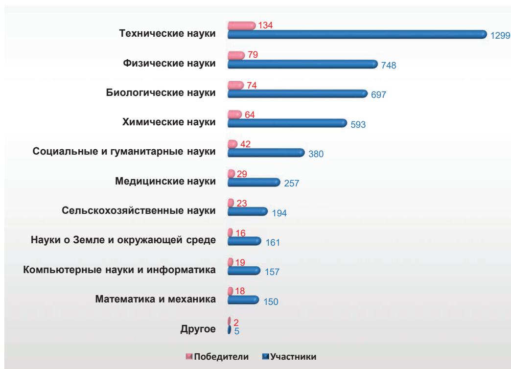
Рис. 2. Распределение участников и победителей по научным направлениям

В конкурсном отборе приняли участие представители 73 регионов страны из всех федеральных округов. Результаты проведенного анализа показали, что безусловным лидером по количеству победителей является г. Москва (162 победителя из 1442 участников). Значительное число победителей – из г. Санкт-Петербурга (68 победителей из 671 участников), далее следуют Томская область (41 победитель из 194 участников), Московская область (29 победителей из 229 участников) и Новосибирская область (26 победителей из 257 участников).