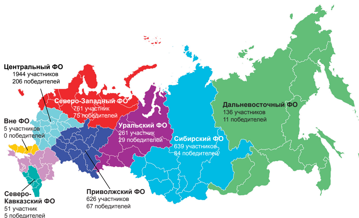
Рис. 3. Распределение участников и победителей по федеральным округам

Распределение участников и победителей по федеральным округам представлено диаграммой на рис. 3.