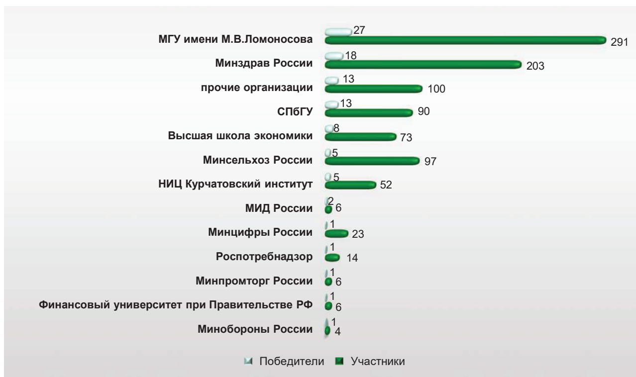
Рис. 4. Распределение участников и победителей по ГРБС (за исключением Минобрнауки России)

90 участников), Уральский федеральный университет имени первого Президента России Б.Н. Ельцина (12 победителей из 89 участников) и Сколковский институт науки и технологий (10 победителей из 67 участников) – диаграмма на рис. 5.